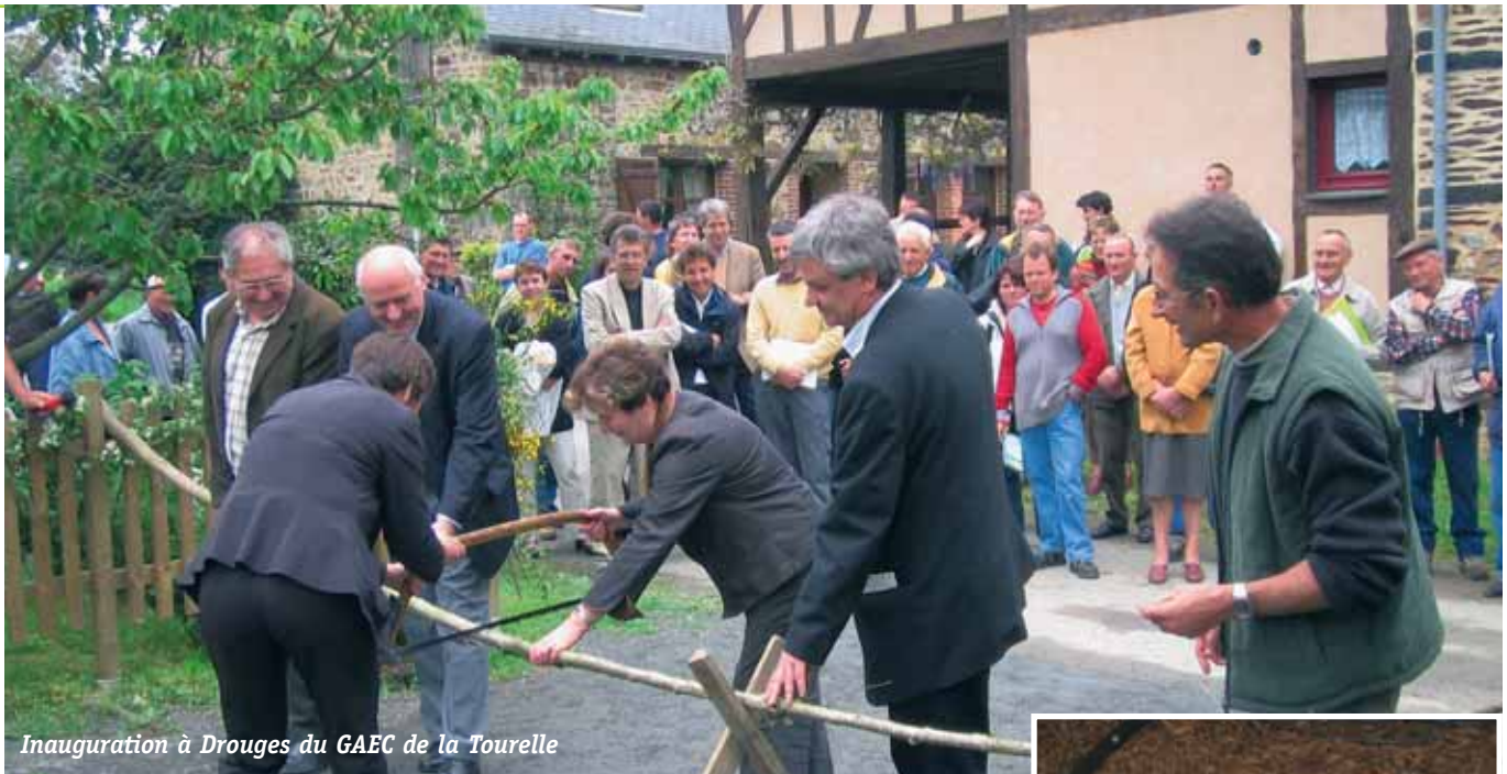
Inauguration à Drouges du GAEC de la Tourelle

Des haies, une déchiqueteuse, du temps pour le séchage, un silo d'alimentation, un racleur et une chaudière, voilà en résumé, les ingrédients pour chauffer quatre maisons d'habitation.