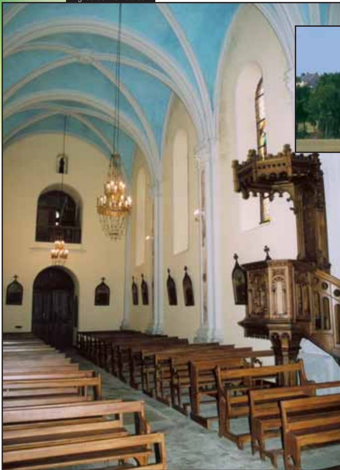
Eglise de Montautour